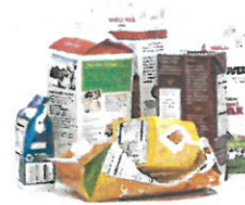
Food & Beverage Cartons Cartones de alimentos y bebidas

Do NOT include in your mixed recycling cart: