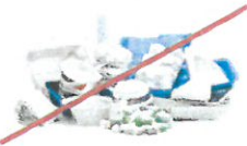
NO Foam Cups & Containers NO vasos y recipientes de poliestireno