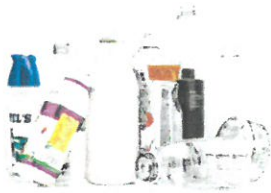
Plastic Bottles & Containers Botellas y envases de plástico