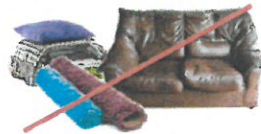
NO Clothing, Furniture & Carpet NO ropa, muebles y alfombras