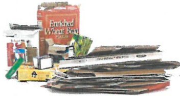
Flattened Cardboard & Paperboard Cartón y cartulina aplastados