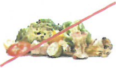
NO Food or Liquids NO comida o líquidos

NO incluya en su contenedor de reciclaje mixto: