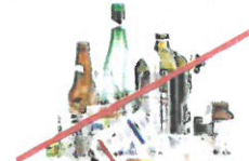
NO Glass Bottles & Containers NO Botellas y frascos de vidrio