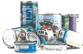
Food & Beverage Cans Latas de alimentos y bebidas